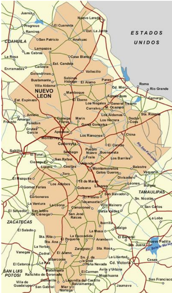
Mapa 1. Carreteras (de color verde) y vías ferroviarias (de color rojo) de Nuevo León. (S/A, Mexico 4 Travellers, 2010).

el noreste de México. San Nicolás de los Garza: Facultad de Filosofía y Letras de la Universidad Autónoma de Nuevo León; pp. 146-150.