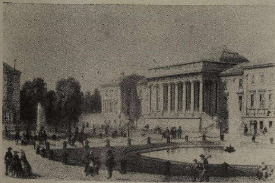
Palacio de Justicia. Tours, 1863.